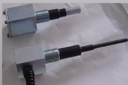
Anodo MMO-Ti & Elettrodo Zn per scambiatori- Pompe