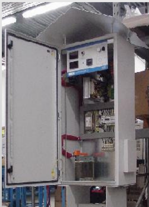
Alimentatore IP 55 Man/Auto