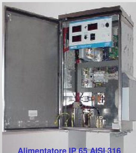
Alimentatore IP 65 AISI 316